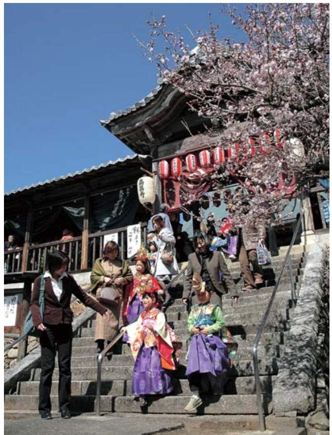
内子町「春の訪れを告げる高昌寺ねはん祭り」(3月14・15日)