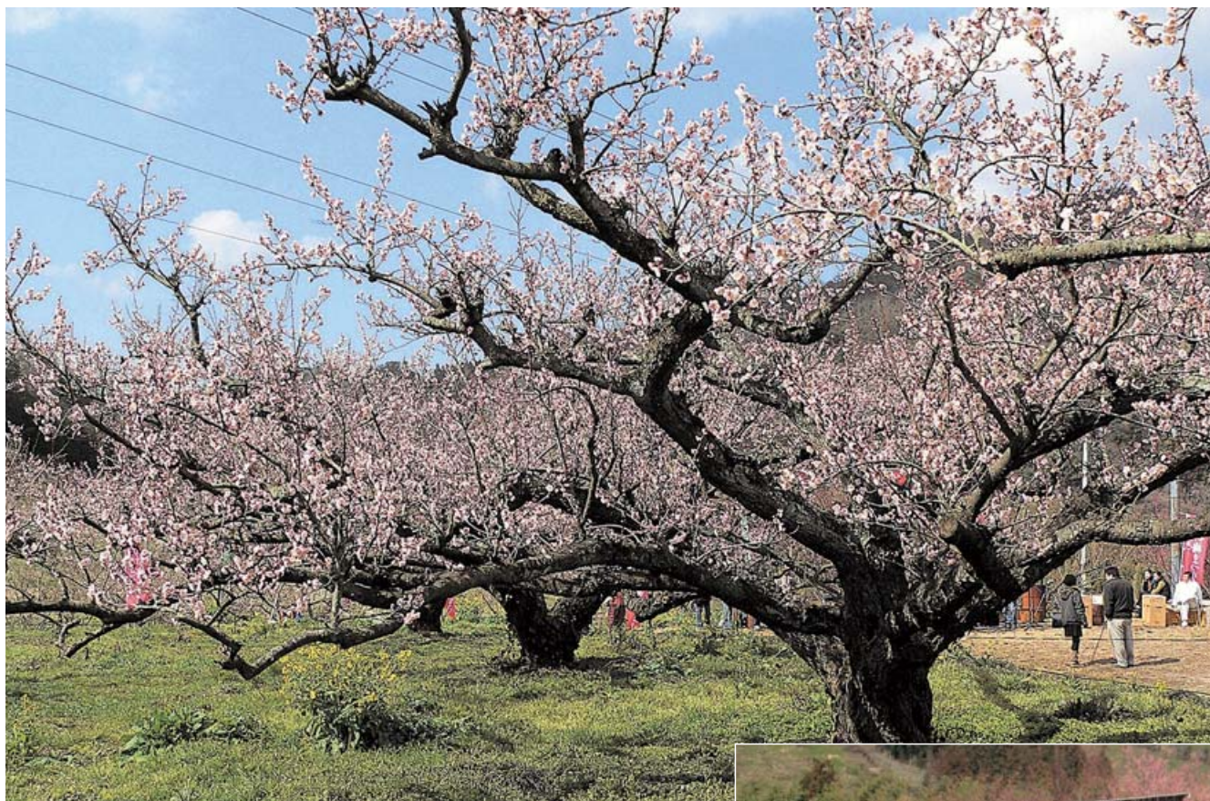
砥部町「七折梅まつり」(2月20日～3月10日)

発行所／愛媛県町村会・愛媛県町村議会議長会 〒790-0001 松山市一番町4丁目1番地2 TEL 089-941-7598(代表) FAX 089-945-1318