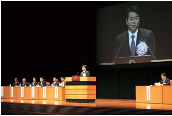
地方分権推進全国会議

会議は、金子全国都道府県議会議長会（鹿児島県）の開会宣言に始まり、原口総務大臣からあいさつが