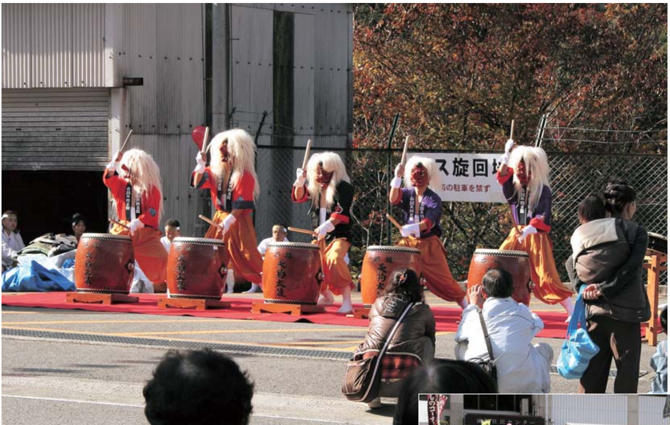
久万高原町第30回面河ふるさとまつり（11月18日） （オープニングイベントでの本組獅子舞と石鎚天狗太鼓）

発行所／愛媛県町村会・愛媛県町村議会議長会 〒790-0001 松山市一番町4丁目1番地2 TEL 089-941-7598(代表) FAX 089-945-1318