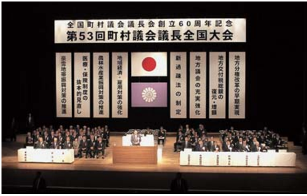
第53回町村議会議長全国大会

全国町村議会議長会は、11月11日東京・NHKホールにおいて、全国の989町村議会の議長など関係者約1700人の出席のもと、「全国町村議会議長会創立60周年記念 第53回町村議会議長全国大会」を開催した。 なお、本年は全国町村議会議長会が創立60周年を迎えたことから、あわせて記念式典を行った。 式典は高田事務総長の司会により進められ、池田副会長（岡山県）の開式のことば、国歌斉唱に続いて野村会長（長野県）が式辞を述べた。 続いて、創立60周年特別表彰を行