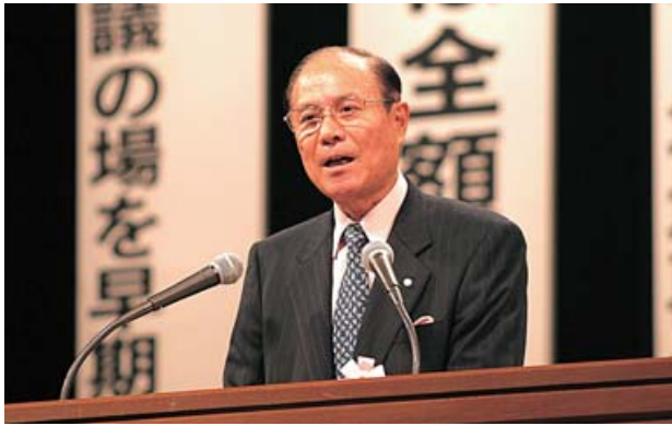
意見表明する白石本会会長