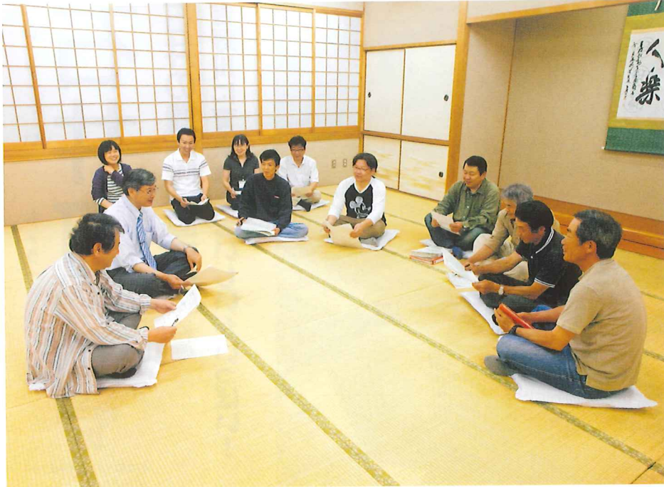
行政の意志決定に住民が積極的に参加し、その経験や知恵をいかす仕組みとして「村づくり住民会議」が立ち上がった。