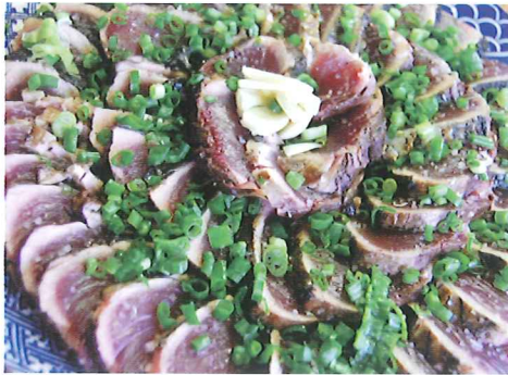
たたきはポン酢のタレが一般的だが、本場の漁師は塩で食べる。