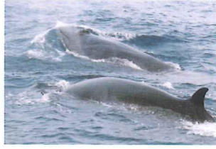
ホエールウォッチング(4~10月・要予約)では、クジラやイルカが見られる。

黒潮町入野の延長約4キロメートルの砂浜をそのまま美術館に見立てた「砂浜美術館」。館長は、沖を泳ぐニタリクジラ。作品は、砂浜に咲くらつきょうや、流れ着く漂流物、波と風がデザインする模様。1989年から始まった「Tシャツアート展」は、一般応募した作品をTシャツにプリントし、砂浜に洗濯物を干すように並べて展示。他にも、らつきょうの花見や、漂流物展など、自然を生かしたユニークなイベントを開催している。