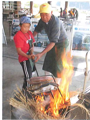
黒潮一番館では、カツオのたたきづくり体験や、レストランでの食事もできる。

黒潮町佐賀は、日本のカツオ一本釣漁の基地として有名。漁港のすぐ隣にある「黒潮一番館」では、その日の朝水揚げしたカツオを午後には食べられる。カツオのたたきづくり体験も(要予約)。わら焼きカツオを地元天日塩で召し上がれ！