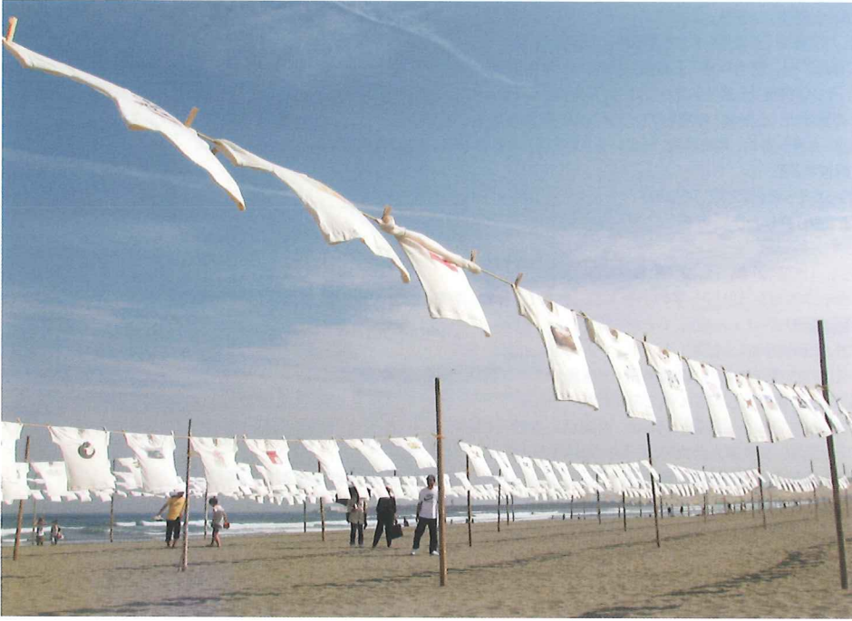
5月の連休に行われるTシャツアート展。砂浜に約1,000枚のTシャツがひらひら。