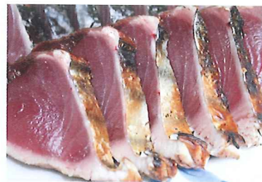
鯉わら焼きタタキ