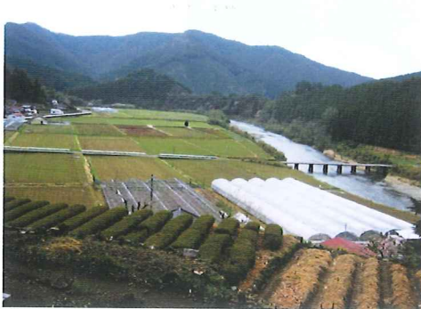
四万十川と広がる農地