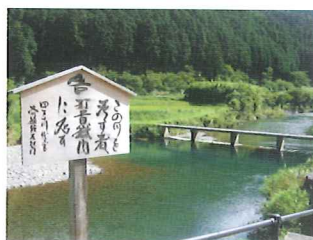
本流一番目「高樋の沈下橋」

四万十源流の里 四万十川と共に 生きてきた人々 四万十川の源流域に位置する中土佐町大野見地区。四万十川の清流は、ひとたび大雨となると、暴れ川と化す。人々は水の恵みと脅威と共に生きてきた。この地には本流一番目から三番までの沈下橋がかかり、四万十川添いには先人の開拓した豊かな農地が広がっている。豊かな台地は良質の米の産地であり、山は四万十松を生む。 平成二十二年二月には大野見地区の四万十源流域は国の重要文化的景観としての選定を受けた。