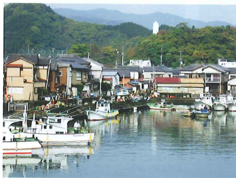
漁師町の風情を感じさせる港風景

四〇〇年以上前から続く鯉漁の町。漫画家青柳裕介氏の「土佐の一本釣り」の舞台となった町でもある。平成四年より「鯉」を主人公にしたまちづくりに取り組み、温泉宿泊施設、鯉のタタキづくりの体験施設、鯉のあらで育てた苳を使ったケーキショップを建設。町内外から多くの人が訪れている。また毎年五月の第三日曜日は「かつお祭」が催され、町の人口を大きく上回る一万八千人の人数にぎわう。