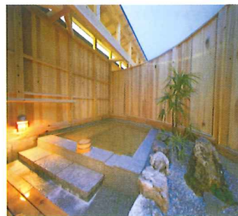
北川村温泉「ゆずの宿」。泉質は日本でもトップクラス。

柚子の栽培を奨励したのは村出身の幕末の志士「中岡慎太郎」。飢饉に苦しむ村人に柚子を塩代わりの防腐・調味料として使う事を奨励した事が始まりだった。今、慎太郎が奨励したその「柚子」が村を支えている。