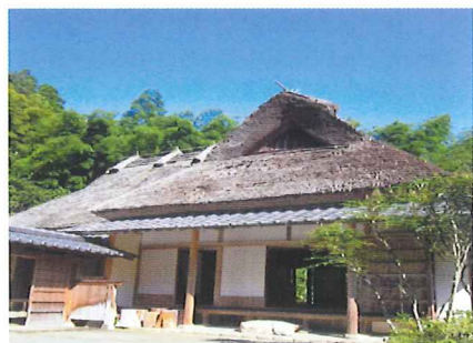
幕末の偉人「中岡慎太郎」の生家。