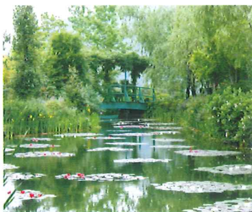
北川村モネの庭マルモッタン

「花の庭」、「水の庭」、「光の庭」があり、「青い睡蓮」や「クロード・モネ」の名を冠したバラ等、ここでしか見る事の出来ない植物が溢れている。