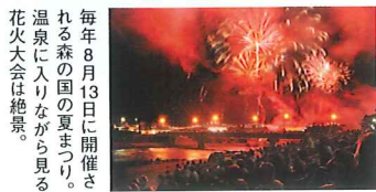
毎年8月13日に開催される森の国の夏まつり。温泉に入りながら見る花火大会は絶景。