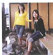
JR松丸駅下車。ホームの階段を上がって森野君ぼっば温泉の足湯コーナーでしばし休憩。列車の待ち時間にぜひご利用してください。

走ること暫し、松丸駅には「森の国ボツボ温泉」があり、町内の造り酒屋の大きな酒樽を使った露天風呂や滑床溪谷をイメージした岩風呂、無料の足湯などが楽しめる癒しのスポットとなっている。ちなみに、この露天風呂の酒樽で作られていた酒の銘柄は「伊予美人」。癒しと美貌を手に入れる効能がある温泉かも。