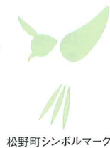
松野町シンボルマーク