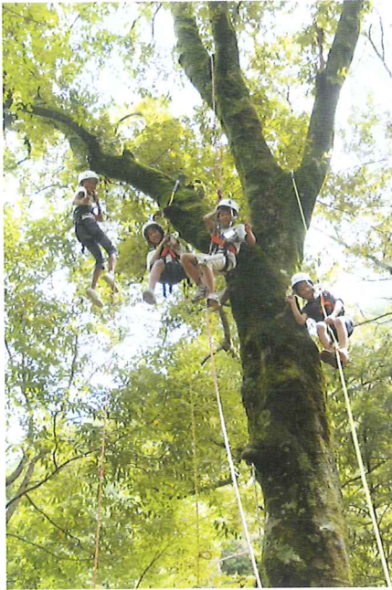
「この森に学びこの森に遊びて あめつちの心に近づかむ」 この子らに残したい大自然の恵み。