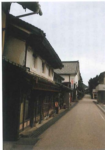
伊予と土佐の交易の要衝として栄えた面影を残す旧松丸街道。森の国ぼっば温泉は、この街道に位置するJR松丸駅にある温泉。