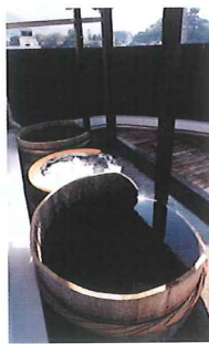
清酒「伊予美人」の仕込み樽を利用した「森の国ぼっば温泉」の露天風呂。このお風呂に入ると美人になれる。