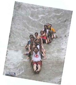
日本の滝百選「雪輪の滝」は天然の滑り台になる。最近日本有数のキャニオニングのポイントとして注目の滑床溪谷。