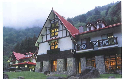
滑床溪谷にある「森の国ホテル」。赤い大屋根と白い漆喰の壁が周囲の緑と絶妙のコントラストを見せる。上質なおもてなしと料理が評判のホテル。