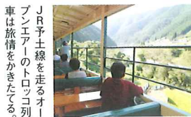
JR予土線を走るオーブンエアーのトロツコ列車は旅情をかきたてる。

日本最後の清流「四万十川」。 この沿沿たる流れの最初の一滴が始まる場所のひとつに「滑床溪谷」があります。美しい渓谷美、豊かな森林美、時間を忘れるほどの展望美が評され「国立公園」にも指定されている。 滑床溪谷は、遊びと学びの宝庫。四季折々の美しさが楽しめる溪谷散策をはじめ、アカシヨウビンやカワセミなどの100種類以上の鳥たちのパードウオッチング、アメゴの渓流釣り、溪谷をまさに体験できる滝すべりやキャニオニング、木登りやキャンプなど、自分なりの滑床溪谷を存分に楽しんでください。