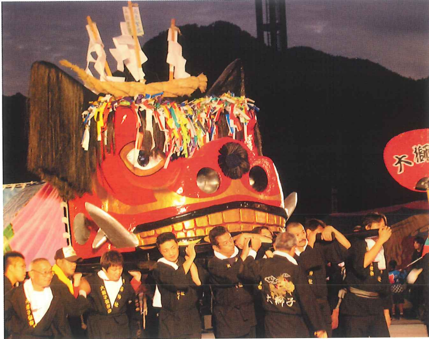
迫力満点の天野神社大獅子