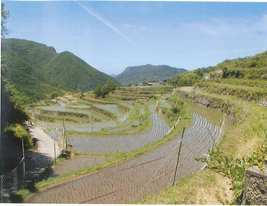
田植えが終わってすぐの中山千枚田。季節によって色んな表情を見せ、訪れる人を楽しませてくれる。