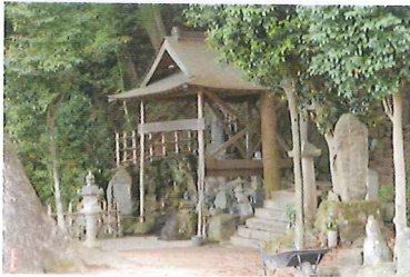
日本名水百選に選ばれた湯船の水。山腹から湧き出る水は、干ばつの時にも枯れることがないといわれている。