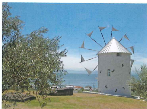
青い瀬戸の海を見渡せ、園内では50種類、2000本のオリーブが植栽されており、日本ではここにしかないオリーブの木もある。