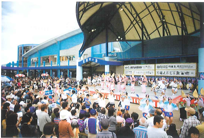
吉野川ハイウェイオアシス:地元阿波踊り連6連の合同による阿波踊り無料公演の様子

島の総合レジャー施設として年間100万人を超す人々が利用する。中でも年間を通じて開催される、徳島の郷土芸能「阿波踊り」の無料定期公演は人気で、目の前で繰り広げられる乱舞は訪れる人々を魅了している。