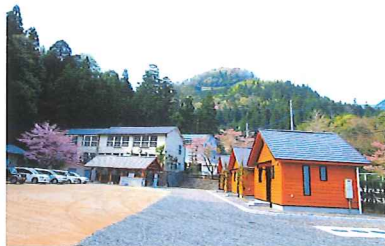
和室6畳一間・浴室・トイレなどを備えた3棟のバンガロー

ゆ〜っくり、の〜んびり、お手軽「いなか体験」 蛭でも有名な増川地区の木造校舎を改築した施設で、そばづくりや稲刈りなどの農林業体験が楽しめる。