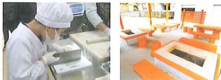
そばづくり体験の様子