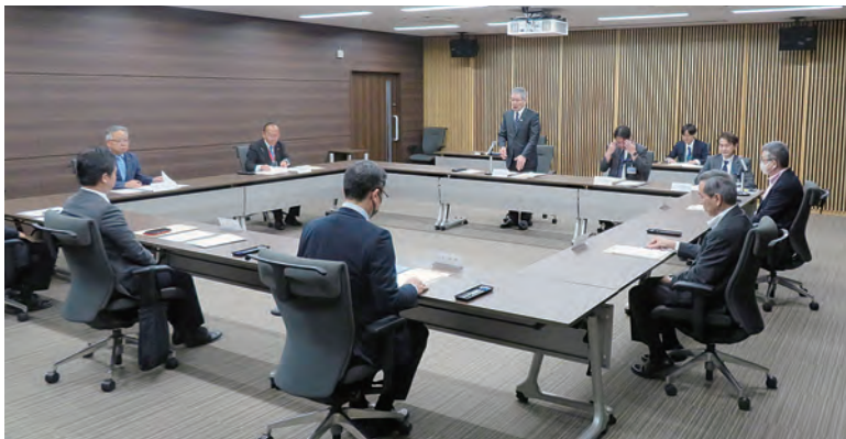
理 事 会