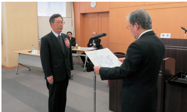
西村愛南町代表監査委員に表彰