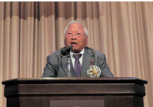
開会のことばを述べる 三谷愛媛県町村議会議長(砥部町議会議長)

え、トークセッション方式で講演を開催した。なお、大会終了後には、中村愛媛県知事、三宅愛媛県議会議長臨席のもと意見交換会が盛大に開催され、出席者の交流が図られた。