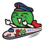
徳島県 マスコット 新幹線すだちくん