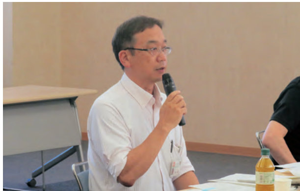
説明をする雲峰課長(県市町振興課)