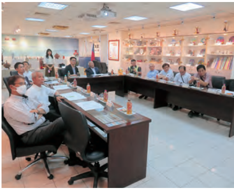
新北市立鶯歌高級工商職業學校

多様な専門科目が設置されており①陶磁器科、②美術工芸科、③広告デザイン科、④コンピュータサイエンス科、⑤情報処理科、⑥特殊学級、⑦スポーツ総合クラス、