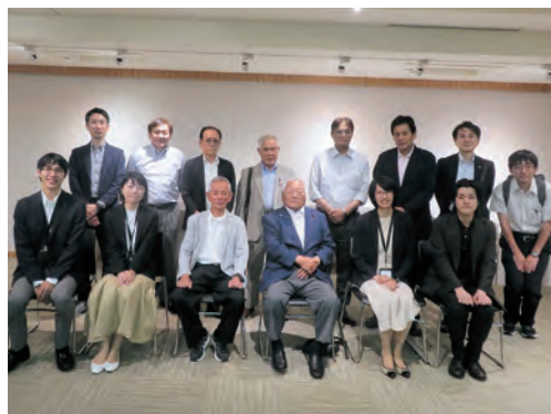
(公財) 日本台湾交流協会 台北事務所

また、持参した「えひめの町ガイド(繁体字版)」にて、県内9町の魅力の発信・PRを依頼した。