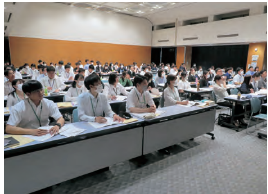
研 修 会