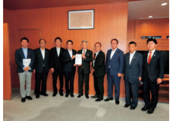
文部科学省 盛山大臣（左から5番目）