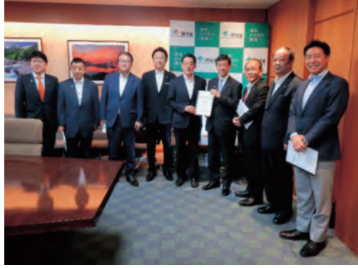
環境省・内閣府（原子力防災担当） 伊藤大臣（左から6番目）