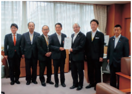
農林水産省 横山事務次官（左から5番目）