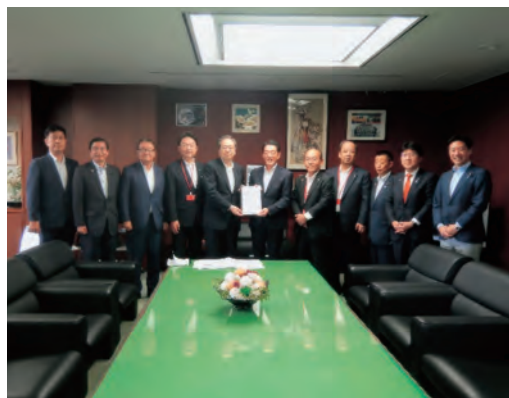
国土交通省 齊藤大臣(左から5番目)