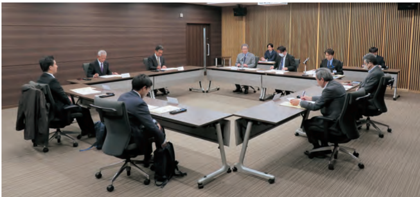
理 事 会