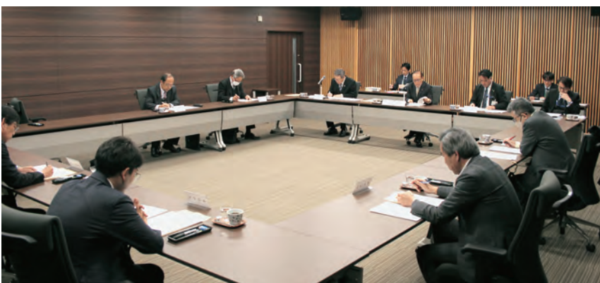
評 議 員 会