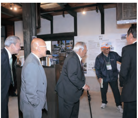
砥部むかしのくらし館