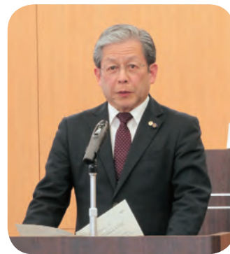
あいさつをする赤穂会長 (内子町代表監査委員)