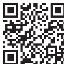
【ふるさとチョイス】