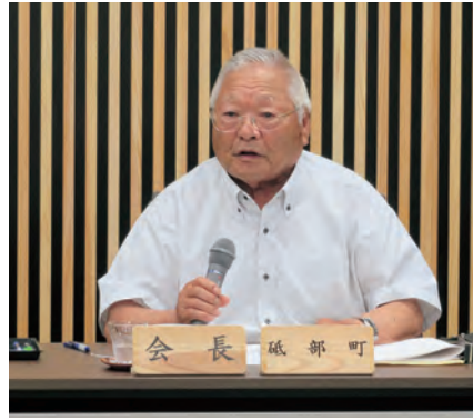
あいさつをする三谷会長