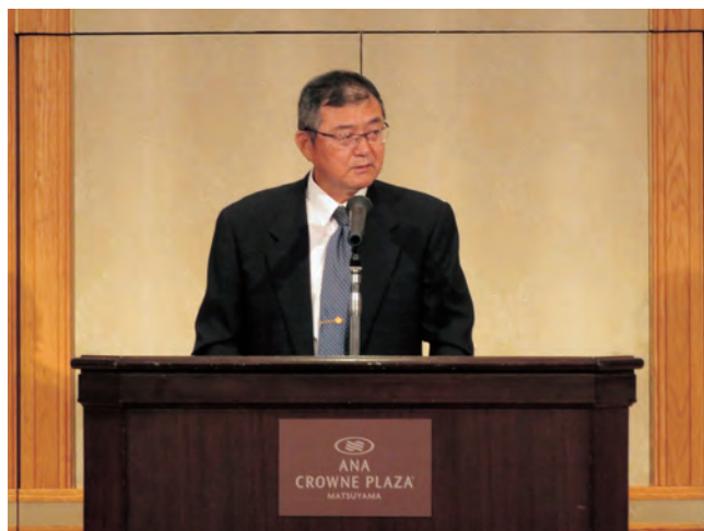
開会あいさつを述べる森本本県会長