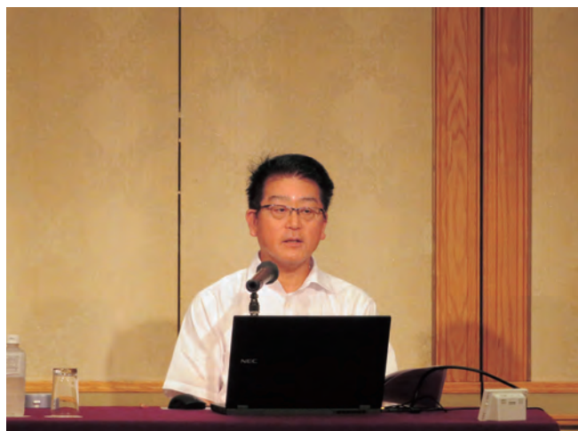
講師：影浦砥部町代表監査委員

最後に、次期開催県である香川県町村監査委員協議会の新名会長の閉会挨拶があり、研修会を終えた。