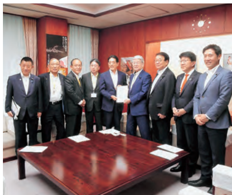
農林水産省 野村大臣(左から6番目)