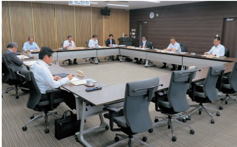
臨 時 総 会

説明があり、協議の結果、認定第1号及び認定第2号は認定、議案第1号については、決定した。