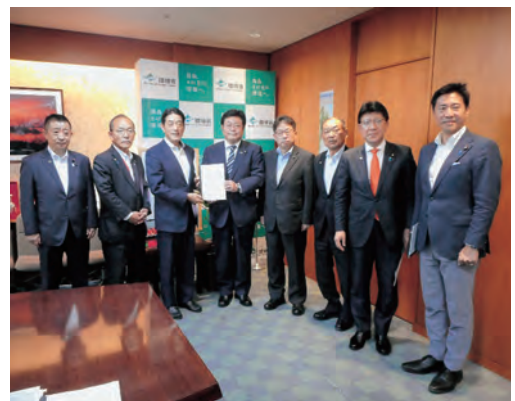
内閣府(原子力防災)、環境省 西村大臣(左から4番目)