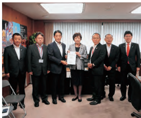
経済産業省 太田副大臣 (左から4番目)