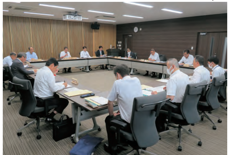
全 員 連 絡 会

日本自治体労働組合総連合会(自治労連)愛媛県本部からの要請書について 本会事務局が報告し、一同了承