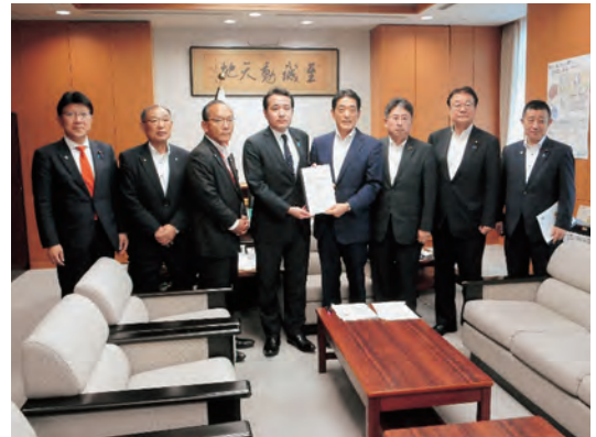
文部科学省 築副大臣 (左から4番目)