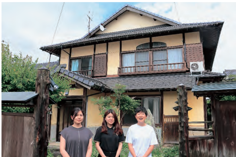
▲ 北宇和高校 高校寮(仮)

発行所／愛媛県町村会・愛媛県町村議会議長会 〒790-0001 松山市一番町4丁目1番地2 TEL089-941-7598(代表) FAX089-945-1318