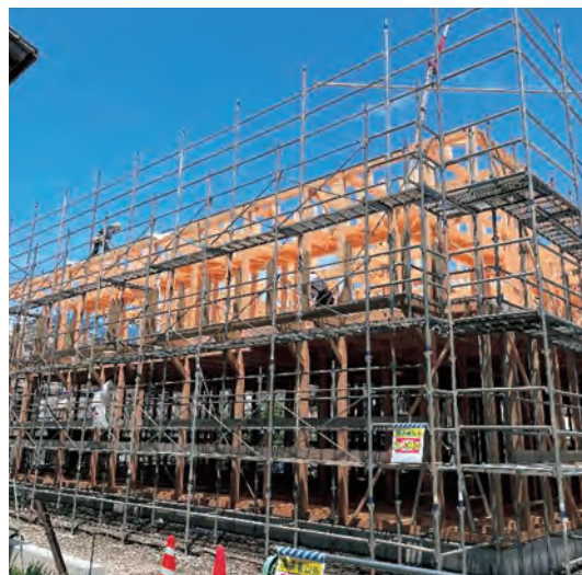
▲ 北宇和高校 高校寮(建設中)