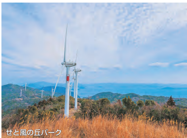
せと風の丘パーク