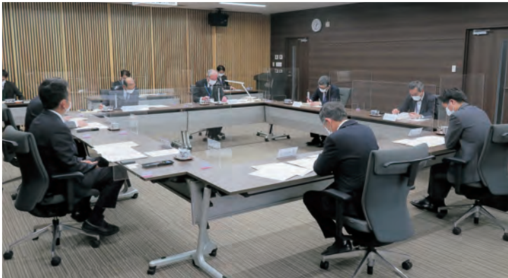
理 事 会