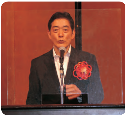
祝辞を述べる中村愛媛県知事

続いて、祝辞を述べた以外の来賓として、森愛媛県市町振興課長を紹介した後に、原田愛媛県町村議会議長(愛南町議長)の発声により町長と議長の意見交換が行われた。最後に、河野副会長が閉会の言葉を述べ、定期総会の全行事を終了した。