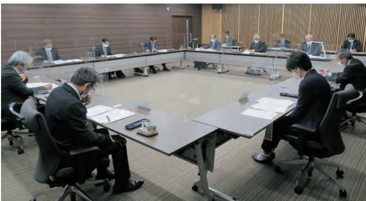
評 議 員 会