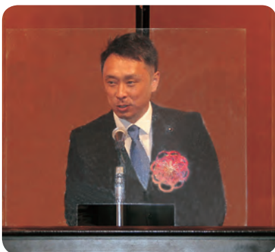
祝辞を述べる 西原愛媛県議会議長