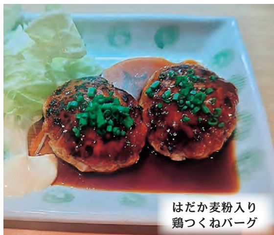
はだか麦粉入り 鶏つくねバーグ