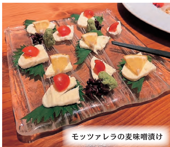
モッツアレラの麦味噌漬け

発行所 / 愛媛県町村会・愛媛県町村議会議長会 〒790-0001 松山市一番町4丁目1番地2 TEL089-941-7598(代表) FAX089-945-1318