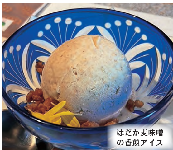
はだか麦味噌 の香煎アイス