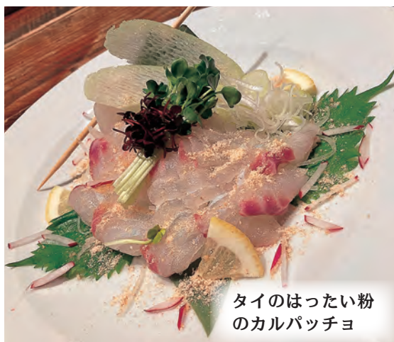
タイのはったい粉 のカルパッチョ