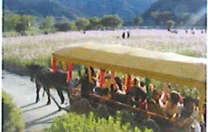
園内を優雅に1周する花馬車