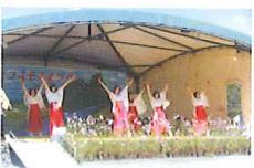
舞台ではいろいろな催しが

コスモスまつり コスモスから広がる未来、かけがえない自然 町花は「コスモス」。毎年、秋には「コスモスまつり」が開催され、様々なイベントが行われる。