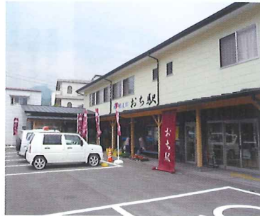
観光物産館おち駅

コスモスまつり コスモスから広がる未来、かけがえない自然 町花は「コスモス」。毎年、秋には「コスモスまつり」が開催され、様々なイベントが行われる。