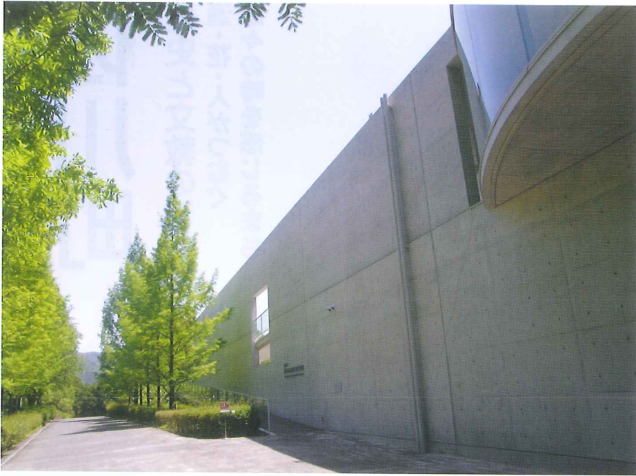
横倉山自然の森博物館