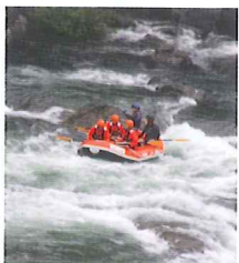
ソフト・ラフティングで自然を満喫

仁淀川 “奇跡の清流” 仁淀川であそぼ体験 カヌー・ソフトラフティングで仁淀川をまるごと体験、自然を満喫。