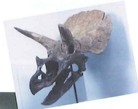
トリケラトプスの化石