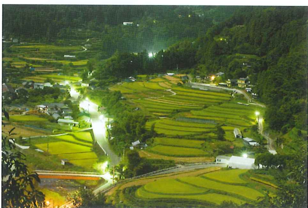
日本で最も美しい村連合に加盟し、景観や環境、文化を守る活動に取り組んでいる。

【問い合わせ先】 株式会社 高鉦建設 酒販事業部 TEL0885-44-1388