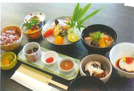
薬草料理教室は、日帰り・1泊2日・1週間コースから選べる。

葉っぱや花を料理のつまものとして商品化した葉っぱビジネス「いろどり」は上勝が発祥。軽い葉っぱはお年寄りでも扱うことができるため、現役で働くお年寄りがたくさんいて、「いろどり」は元気の源にもなっている。来年2012年にはこの葉っぱビジネスを描いた映画「そうだ、葉っぱを売ろう！」が全国で公開される予定。全国の皆さんに上勝から元気をお届けします！