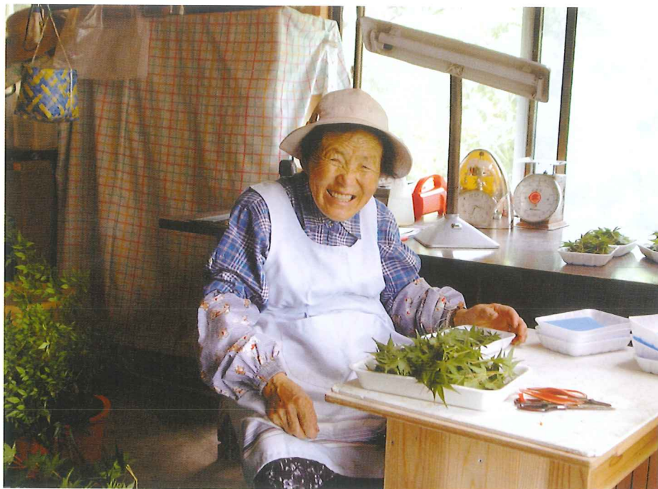
出荷作業をするおばあちゃん