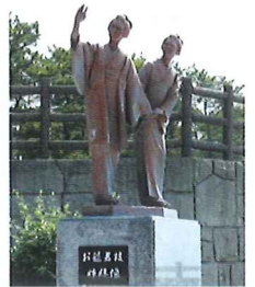
坂本龍馬の妻お龍は、龍馬の死後、妹の嫁ぎ先である芸西村に1年ほど滞在していた。そのことを記念して建てられた姉妹像は、桂浜の龍馬像に手を振っているようにも見える。

2011年1月、ドイツで開催された世界47カ国1500の出展者で開催される世界最大級の国際園芸見本市「IPM ESSEN 2011」で切り花部門最優秀賞を受賞した芸西村のブルースター「ピュアブルー」。平成18年にブランド化したオリジナル品種であり鮮やかなブルーの花びらが星のように咲くのが特徴的。芸西村は全国シェア9割を占める一大産地である。花言葉は「信じあう心」。ブライダル業界では大人気の花である。