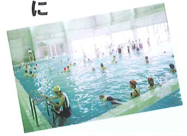
海水プール芸西/目前に広がる美しい琴ヶ浜を眺めながら、海水が持つ天然の成分を利用したタラソテラピーで「こころ」も「からだ」も癒される。