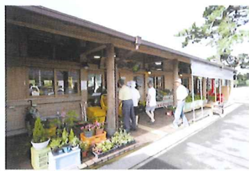
赤いノボリが目印。地元産の野菜、朝どれの鮮魚や芸西村の特産品かっぱバーガーや黒糖入りビーマン味噌も販売!

波が引いてゆく時、砂が転がり海水の中に妙な音が聞こえることや砂丘の形状がふくれた琴の胴にも見えることから古きころより「琴ヶ浜」と呼ばれ人々に親しまれてきた美しい海浜。東西に約6キロメートルにおよぶ松林の中を抜けるようにサイクリングロードが整備されており、潮風とともに走るシーサイドサイクリングが人気の観光スポーツだ。美しい景観を利用した「観月の宴」など多くのイベントが開催される。周辺には海水を利用した「海水健康プール芸西」や「琴ヶ浜松原野外劇場」「地場産品直販所「かっぱ市」」があり来場客で賑わいをみせている。