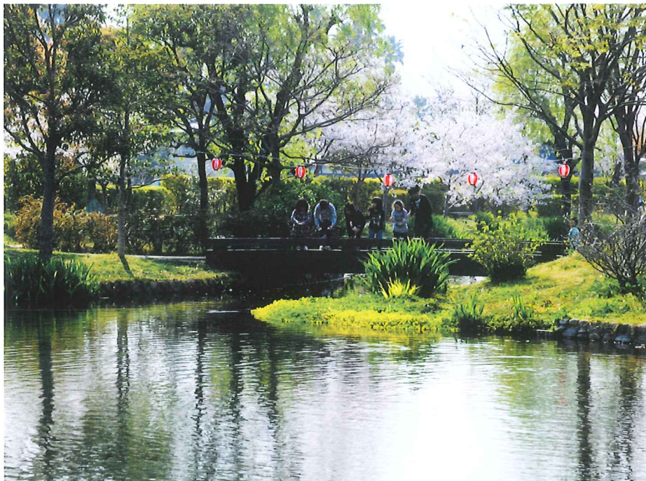
重信川の伏流水で形成された「ひよこたん池」公園。 松前町は、このような親水空間を誰もが安全に利用できる憩いの空間として整備している。

上ノ有明公園の川岸には家ごとに、かつての洗い場（くみじ）が残り、当時の生活様式を物語る。