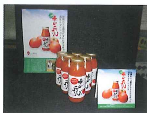
化学調味料は一切使用しない 無添加で安全なジュース。

またその「大師堂」は、伝統的な寺院建築を基調としながらも、洋風を意識したデザインを随所に取り入れた近代和風建築の代表的な寺院として平成十九年六月に「国指定重要文化財」に指定された。