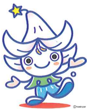
イメージキャラクターゆりぼう 様々なイベントで大活躍している。

【問い合わせ先】「赤の元気」 農業法人(株)FFT TEL090-2781-5186